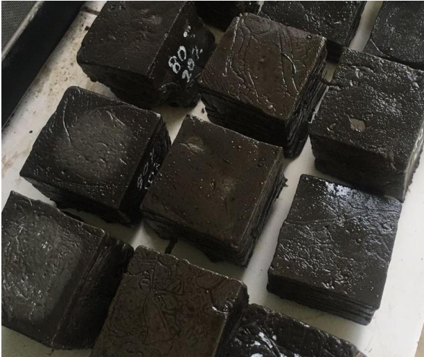
Gambar 1. Spesimen Uji Paving Block Campuran PET

Hasil dari penelitian Pemanfaatan Sampah Plastik PET (Polyethylene Terephthalate) dan Oli Bekas Sebagai Campuran Pada Paving Block dapat dilihat pada gambar 1.