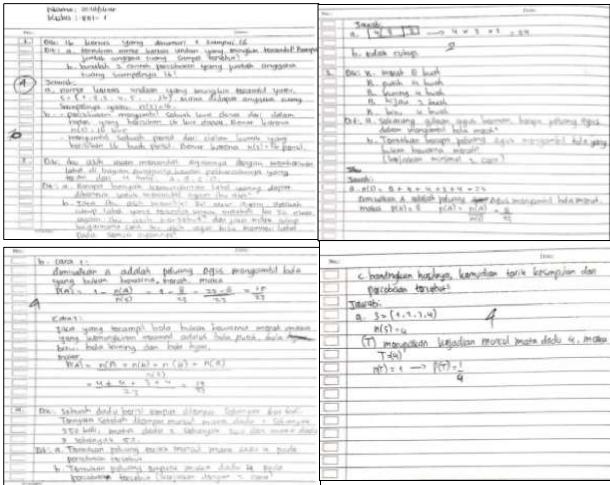
Gambar 1. Jawaban Soal Kemampuan Berpikir Kreatif Matematis Siswa Di Kelas Eksperimen

kemampuan berpikir kreatif siswa yang mendapat perlakuan dengan pendekatan Open Ended menunjukkan peningkatan secara signifikan dibandingkan dengan siswa yang mendapat perlakuan pembelajaran konvensional dengan pendekatan saintifik. Hasil jawaban siswa dapat dilihat sebagai berikut.