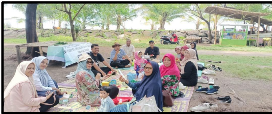
Gambar 4. Saatnya Tim menikmati konsumsi setelah Bersih - bersih Pantai