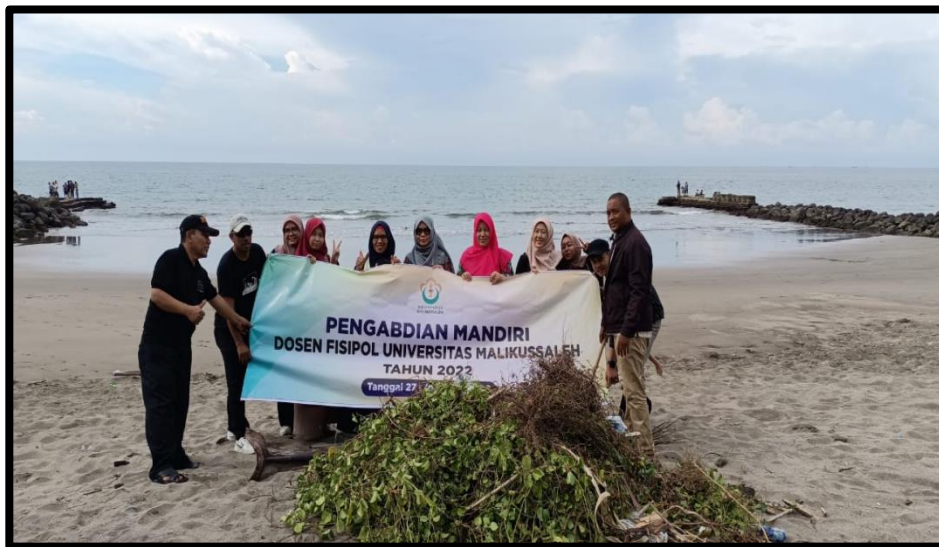
Gambar 1. Tim pelaksana pengabdian bersih pantai pelabuhan Kreungeukueh 27 -28 Juni 2022

Berikut beberapa foto kegiatan yang dilakukan :