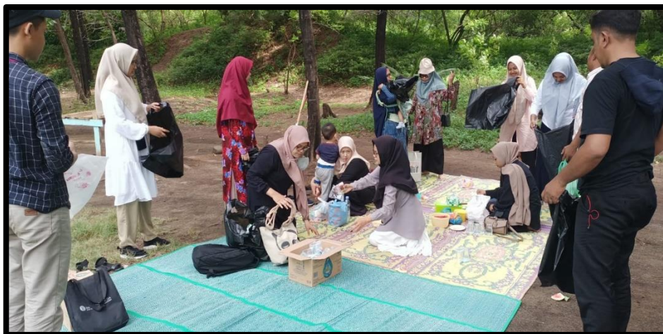
Gambar 5. Persiapan Pulang Tim Pelaksana Pengabdian