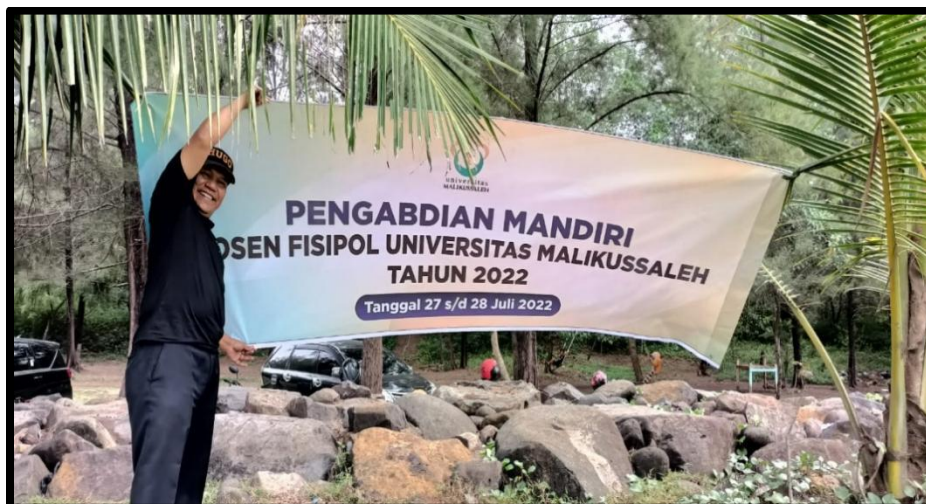
Gambar 2. Semangat tim Pengabdian