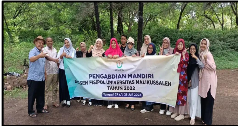
Gambar 6. Semnagat Tim Pelaksana Pengabdian