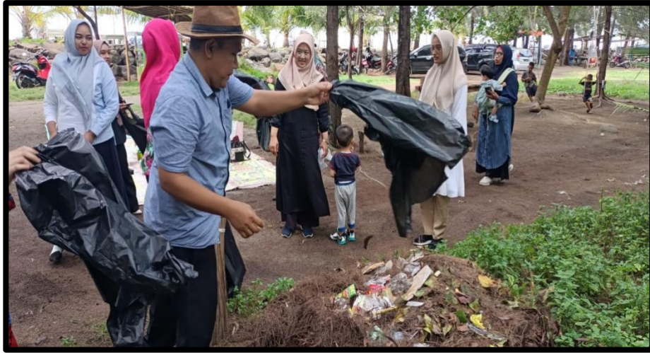
Gambar 3. Aksi bersih - bersih pantai Pelabuhan Kreungeukeuh