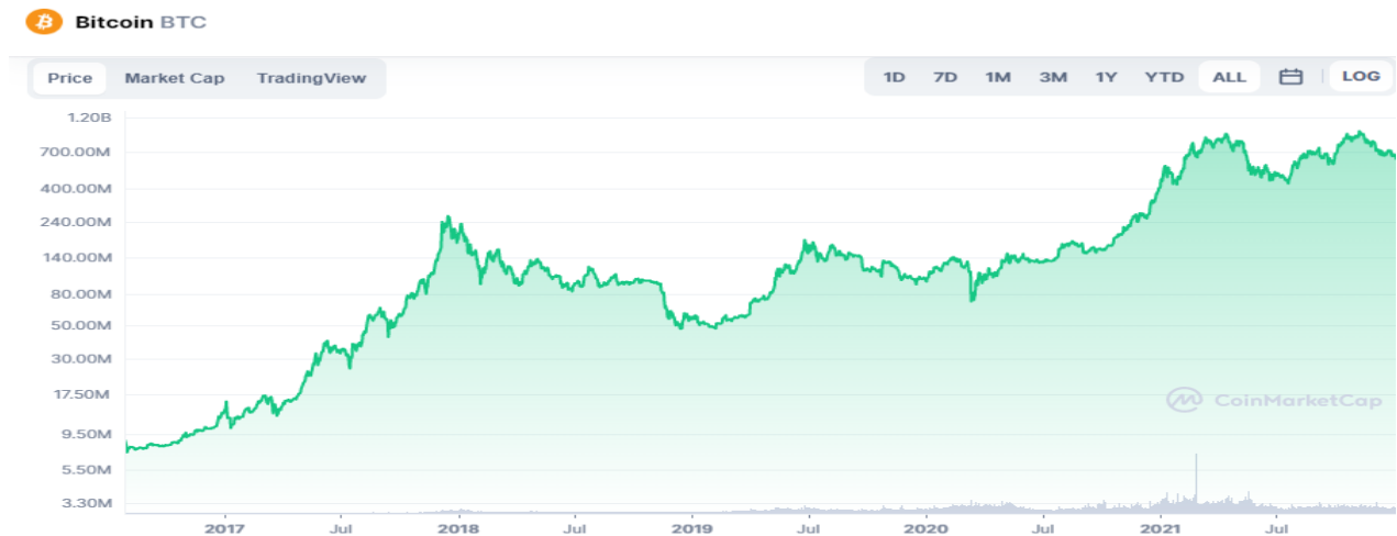
Gambar 2. Kenaikan Harga Bitcoin Tahun 2017-2021 (Rp)

Saat ini Cryptocurrency atau mata uang kripto menjadi tren di kalangan para investor, meskipun regulator belum memberikan perlindungan maupun dukungan terhadap investasi tersebut, tetapi jumlah investor kripto setiap tahunnya malah mengalami kenaikan. Menurut databoks (2019) riset yang dilakukan web global index pada tahun 2019 menyatakan bahwa 10% pengguna internet di Indonesia memiliki cryptocurrency dimana persentase tersebut membuat Indonesia menempati posisi ke 5 di dunia. Ditambah lagi melesatnya harga bitcoin dan altcoin pada 2021 yang bisa dikatakan harga tertinggi dalam sejarah cryptocurrency . Hal tersebut membuat crypto makin dikenal masyarakat Indonesia yang ditandai dengan banyaknya user active dalam marketplace crypto dalam negeri, yaitu lebih dari 3 juta masyarakat memiliki akun aktif di indodax sebagai salah satu marketplace aset kripto terbesar di Indonesia (Suara.com, 2021). Hal tersebut juga dibuktikan oleh salah satu Payment Service Provider (Triple-A) yang mendukung cryptocurrency sebagai alat pembayaran menyatakan bahwa diperkirakan lebih dari 7,2 juta orang, yaitu 2,66% dari total populasi Indonesia, saat ini memiliki Cryptocurrency (TripleA, 2021).