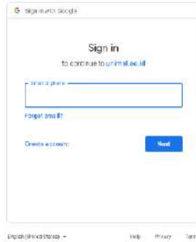
Gambar 2 Masukkan Email