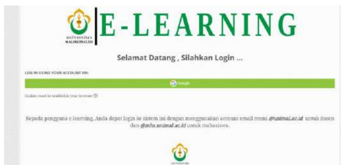
Gambar 1 Login email

1. Tampilan pertama, ketika kita membuka web e-learning, kita harus mempunyai akun email terlebih dahulu.