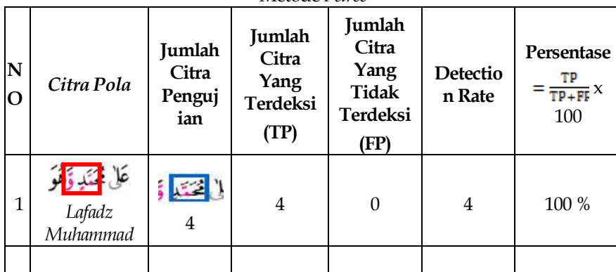
Tabel 4.1 Hasil Unjuk Kerja Sistem Pendeteksi Citra Pola Lafadz Muhammad Metode Peirce

Dari tabel di atas bahwa sistem pendeteksi pola Lafadz Muhammad menggunakan metode Peirce memperoleh rate yang cukup tinggi dengan menggunakan metode Peirce . Langkah awal pengukuran unjuk kerja sistem dilakukan dengan pelatihan setiap pola lafadz Muhammad. Pada citra Al-Qur'an terdapat lafadz Muhammad, tingkat ketepatan/keakuratan sistem mendeteksi pola lafadz Muhammad ini berkisar 100% dari 4 pengujian. Hasil observasi dan evaluasi hasil dari research (penelitian) yang penulis lakukan didapatkan sebuah kesimpulan bahwa persentase keberhasilan proses pendeteksian pola lafadz Muhammad pada surat Al-Baqarah adalah mencapai 97,5%.