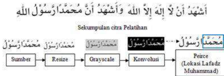
Gambar 3.1 Skema Sistem Secara Keseluruhan

Berdasarkan gambar 3.1 ada beberapa tahapan-tahapan yang dapat dilakukan, yaitu: