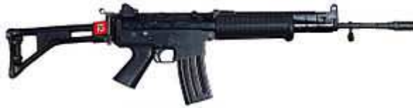
Gambar A Senjata Api Pindad SS1 V1

Steyr AUG dan AK-47 menjadi senjata standar TNI dan POLRI, tapi karena diproduksi di Indonesia, senjata ini paling banyak digunakan. [8]