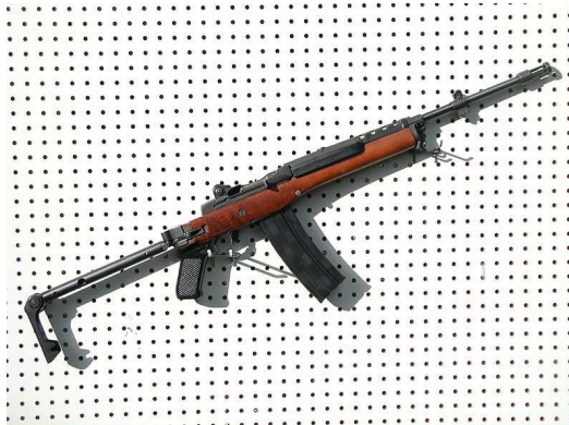
Gambar B. Senjata Api Ruger Mini-14

Mini-14 pertama kali diperkenalkan pada tahun 1974 oleh Ruger. Nama Mini-14 berasal dari militer senjata M14 menyiratkan versi miniatur dari M14. Ruger menggunakan M14 sebagai model untuk senjata baru yang sementara menggabungkan berbagai inovasi dan perubahan rekayasa. Mini-14 terbukti populer dengan pemburu kecil (game), peternak, penegakan hukum, aparat keamanan dan penembak sasaran. [9]