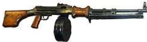
Gambar D. Senjata Api RPD Rusia

RPD (bahasa Inggris : hand-held machine gun of Degtyaryov ) yang dapat diartikan menjadi "senapan mesin tangan Degtyaryov" adalah senapan mesin ringan yang menggunakan peluru kaliber 7,62 x 39 mm M43 buatan Uni Soviet yang dikembangkan oleh Vasily Degtyaryov sebagai pengganti senapan mesin Degtyaryov (DP) yang menggunakan peluru 7,62 x 54 mmR. [11]