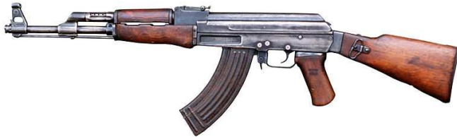
Gambar C. AK 47 Rusia

AK-47 (singkatan dari Avtomat Kalashnikova 1947 ) adalah senapan serbu yang dirancang oleh Mikhail Kalashnikov, diproduksi oleh pembuat senjata Rusia IZhMASH, dan digunakan oleh banyak negara Blok Timur semasa Perang Dingin. Senapan ini diadopsi dan dijadikan senapan standar Uni Soviet pada tahun 1947. Jika dibandingkan dengan senapan yang digunakan semasa Perang Dunia II, AK-47 mempunyai ukuran lebih kecil, dengan jangkauan yang lebih pendek, memakai peluru dengan kaliber 7,62 x 39 mm yang lebih kecil, dan memiliki pilihan tembakan ( selective-fire ). AK-47 termasuk salah satu senapan serbu pertama dan hingga kini merupakan senapan serbu yang paling banyak diproduksi. [10]