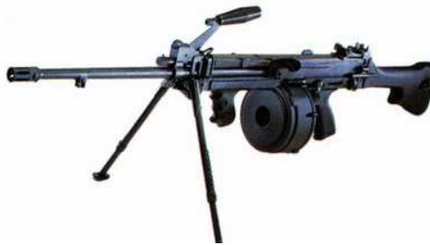
Gambar E. Senjata Api Ultimax

Varian uMk.1 yang lahir pada 1982 hanya dilengkapi laras yang tidak bisa di ganti dan mode penembakan hanya semi-full auto. Sistem feed peluru pun masih menganut sabuk rantai yang rawan macet. Kelemahan ini baru diperbaiki pada varian MK.3 yang dapat diganti larasnya plus mode penembakan yang sudah menganut safe semi-full auto. Mulai varian Mk.3 pula di perkenalkan Ulimax para dengan panjang laras Cuma 330 mm plus magasin drum yang mengingatkan sekilas kepada senjata buatan Blok Timur. [12]