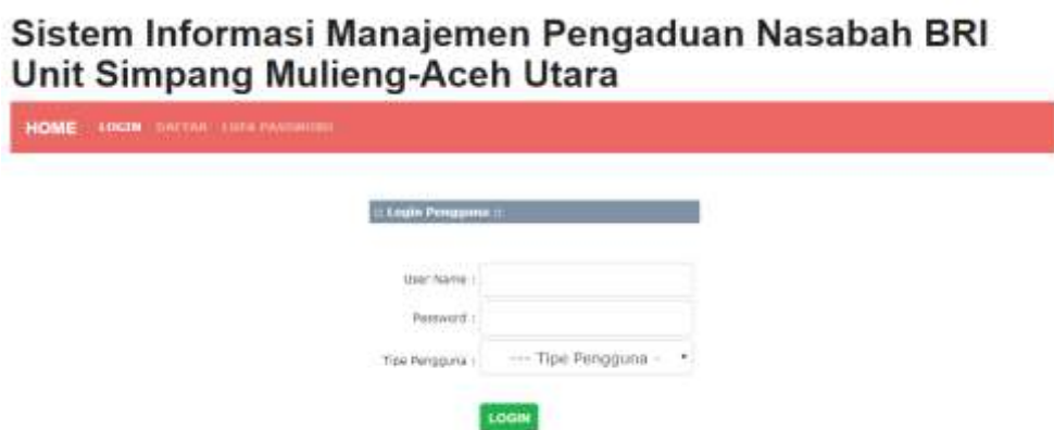
Gambar 1. Tampilan awal