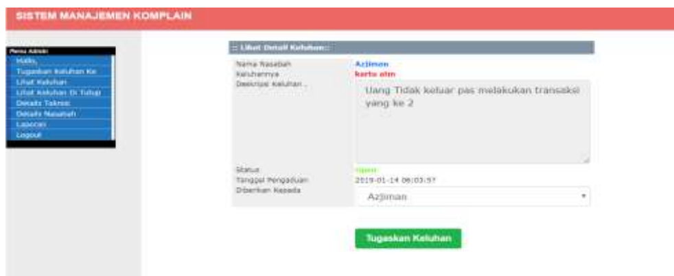
Gambar 4. Detail Keluhan