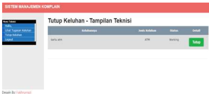
Gambar 5. Keluhan dikerjakan teknisi

Disini teknisi akan melakukan tugas yang diberikan oleh admin, kemudian memverifikasi apakah keluhan nasabah betul terjadinya penodeban atau tidak, dengan cara mengecek saldo dari no.rek nasabah pada sistem informasi bank BRI.