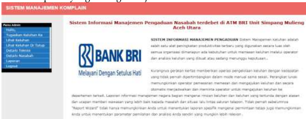
Gambar 3. tampilan awal Admin

Disini admin akan melihat keluhan yang ada dari nasabah, kemudian admin memproses keluhan tersebut, dan memberikannya kepada teknisi atau petugas ATM agar di proses lebih lanjut. Dan Admin juga bisa melihat detail nasabah dan teknisi serta bisa melihat laporan yang sedang dikerjakan oleh teknisi.