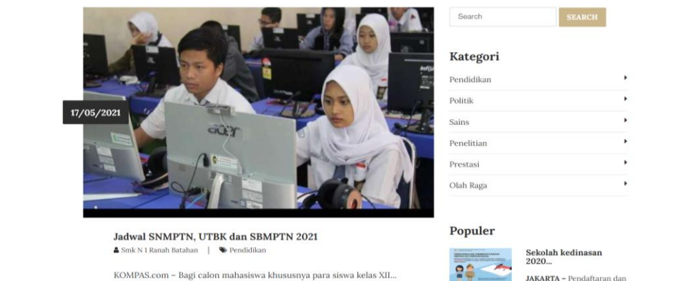
Gambar 4. Web Halaman Artikel

Halaman Artikel berisi berita baik berita di dalam sekolah maupun di luar sekolah. Gambar dibawah ini merupakan tampilan halaman Artikel adalah sebagai berikut: