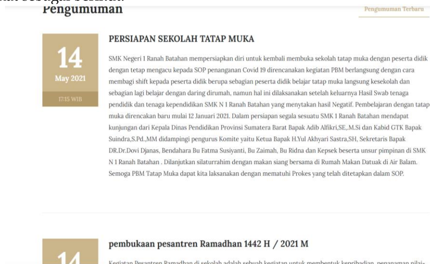
Gambar 5. Web Halaman pengumuman

Halaman Pengumuman berisi pengumuman di sekolah. Gambar dibawah ini merupakan tampilan halaman pengumuman sekolah dapat dilihat sebagai berikut: