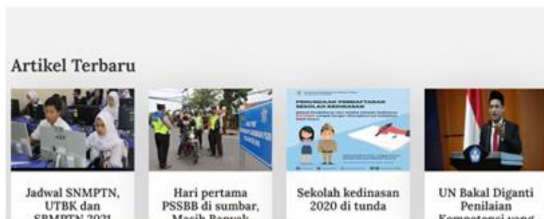
Gambar 3. Desain Form Halaman Utama

Halaman beranda adalah halaman pertama yang di masuki ketika memasuki website, dan juga berisi tentang menu-menu apa yang tersedia.