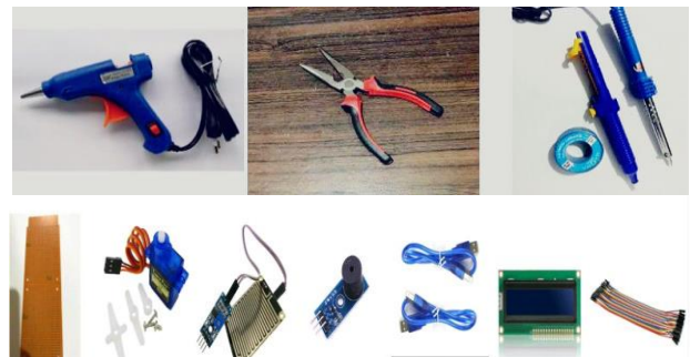
Gambar 2. Alat dan bahan yang digunakan

Peralatan yang digunakan pada penelitian ini adalah: Lem tembak, Tang, Timah, Alat sedot timah dan Solder. Sedangkan bahan-bahan yang digunakan dalam penelitian ini adalah: Papan PCB ( Papan project ), Motor servo, Water sensor, Modul water sensor, Buzzer, Kabel USB, LCD dan Kabel jumper.