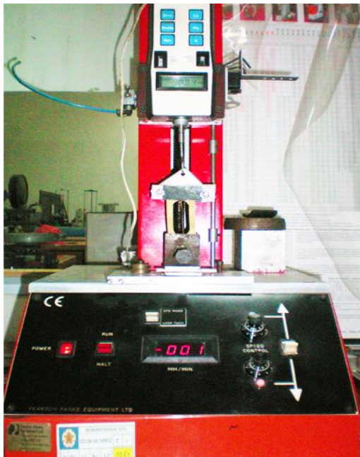
Gambar 1. Alat Uji Tarik Serat TENSOLAB

Peralatan yang digunakan dalam penelitian ini adalah sebagai berikut :