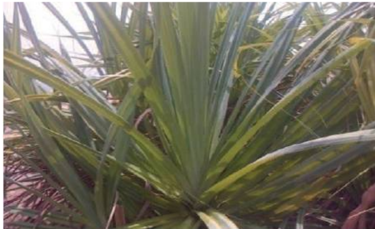
Gambar 1. Pandan Duri ( Pandanus Tectorius )

film, tarpaulin, kano, tampilan kristal cair, hologram, penyaring, sapat (film) dielektrik untuk kondensator, penyekat sapat buat kabel dan pita penyekat. Poliester kristalin cair merupakan salah satu polimer kristalin cair yang digunakan industri. yang pertama dan digunakan karena sifat mekanis dan ketahanan terhadap panas.