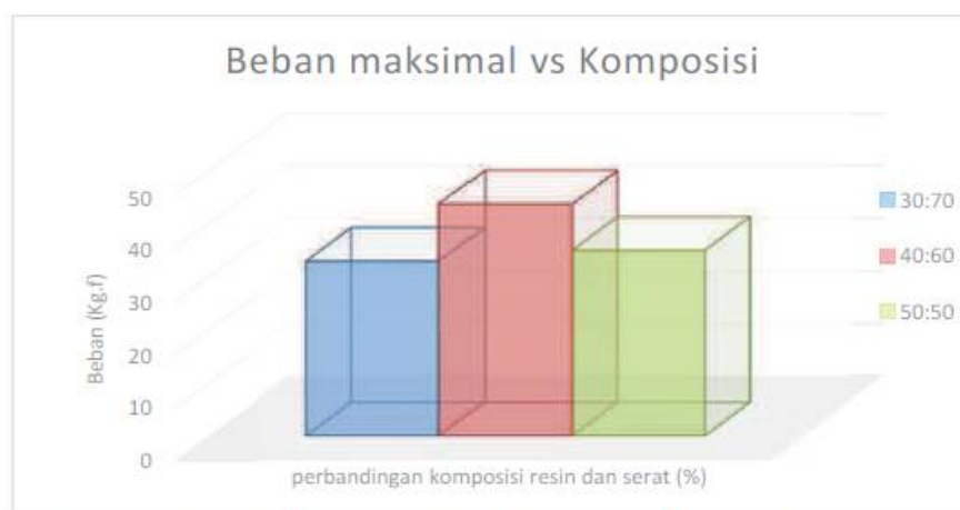
Gambar 3. Grafik Perbandingan Beban Maksimal dengan Komposisi

Setelah melakukan analisa dari ketiga fraksi berat didapat perbedaan dari ketiga fraksi berat yang telah dirangkum dalam grafik di atas, maka dapat disimpulkan bahwa komposisi komposit 40% serat dan 60% resin menghasilkan nilai kekuatan tarik terbaik dengan tegangan maksimal 0.45 \text{ Kgf/mm}^2 dengan beban rata-rata mencapai 43.87 Kgf. Sedangkan pencampuran komposisi resin 50% serat dan 50% resin menghasilkan nilai tegangan tarik yang lebih rendah yaitu 0.35 \text{ Kgf/mm}^2 dengan beban rata rata mencapai 35.16 Kgf. Nilai terendah didapat pada fraksi berat 30% serat dan 70% resin, dengan tegangan tarik maksimal 0.33 \text{ Kgf/mm}^2 dengan beban rata-rata 33.08 \text{ Kgf/mm}^2 .