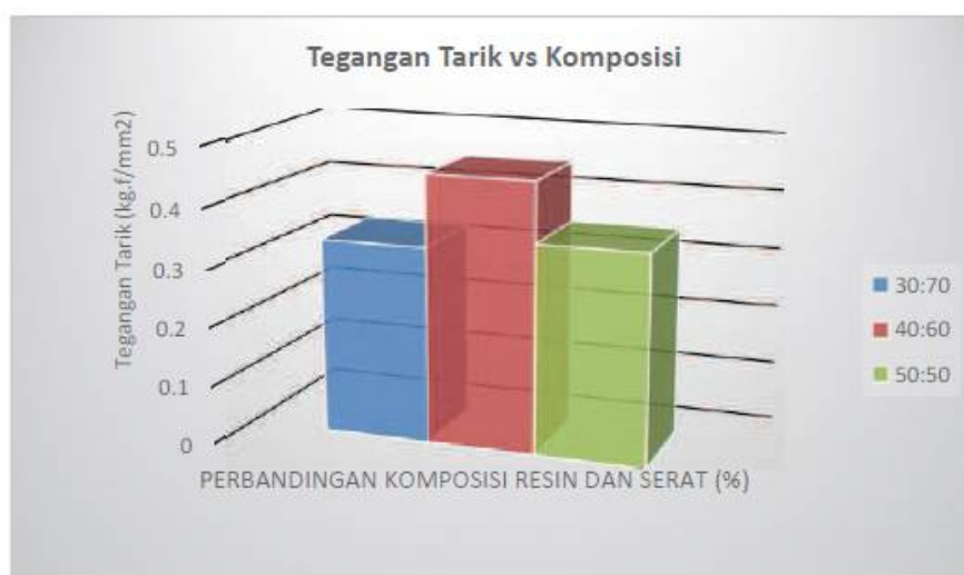
Gambar 2. Grafik Perbandingan Tegangan Tarik pada Variasi Komposisi

Setelah proses pembentukan spesimen material komposit yang berbahan serat pandan duri dengan resin polyester dengan menggunakan acuan dari ASTM D 3039 siap diproses, selanjutnya proses pelaksanaan pengujian tarik terhadap 15 spesimen dari variasi berat yang berbeda dengan masing-masing pengujian akan dirangkum dalam tabel hasil. Dengan dimensi pengujian tarik disesuaikan dengan standar uji ASTM D 3039 dengan dimensi hitung luas yaitu panjang 15 mm dan lebar 6 mm, sehingga luas penampang ( A_0 ) diperoleh 90 \text{ mm}^2 . Variabel yang akan diterangkan adalah hasil tegangan tarik dengan perbandingan perbedaan berat serat pada masing-masing material komposit.