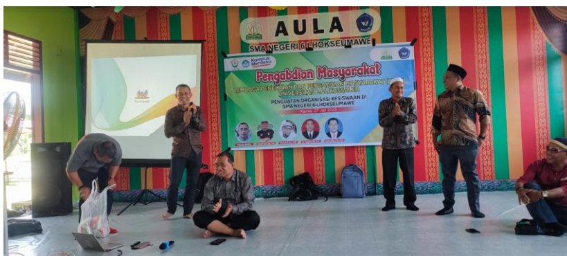
Gambar 4. Dukungan dari Pihak SMA Negeri 6 Lhokseumawe

Dukungan dari pihak sekolah terhadap kegiatan organisasi kesiswaan juga sangat baik sekali. Kepala sekolah dan guru-guru memberikan dukungan penuh dalam bentuk fasilitas, pendampingan, dan apresiasi terhadap kegiatan yang dilaksanakan oleh organisasi kesiswaan. Hal ini tercermin dari alokasi waktu yang lebih fleksibel untuk kegiatan organisasi dan pemberian fasilitas tambahan seperti ruang rapat dan peralatan presentasi.