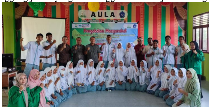
Gambar 1. Pelatihan Manajemen Organisasi dan Kepemimpinan di SMA Negeri 6 Lhokseumawe

Hasil dari pelatihan dan workshop menunjukkan peningkatan signifikan dalam pengetahuan dan keterampilan manajerial serta kepemimpinan anggota organisasi kesiswaan. Partisipasi aktif dalam kegiatan ini menghasilkan pemahaman yang lebih mendalam tentang konsep-konsep penting dalam manajemen organisasi dan kepemimpinan. Anggota organisasi kesiswaan kini lebih mampu mengembangkan dan mengimplementasikan program kerja yang terstruktur dan efektif, serta menunjukkan komitmen dan tanggung jawab yang lebih tinggi dalam menjalankan tugas-tugas mereka.