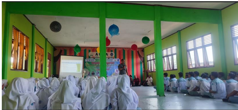
Gambar 2. Partisipasi Aktif Anggota Organisasi Kesiswaan di SMA Negeri 6 Lhokseumawe

Selain itu, terdapat peningkatan komitmen dan tanggung jawab di antara anggota organisasi kesiswaan. Hal ini tercermin dari kehadiran yang lebih konsisten dalam rapat rutin dan pelaksanaan tugas yang lebih baik. Anggota organisasi menunjukkan dedikasi yang lebih besar dalam menjalankan peran dan tanggung jawab mereka, serta berkontribusi secara positif terhadap keberhasilan kegiatan dan program kerja yang direncanakan. Peningkatan ini mencerminkan efektivitas pendekatan yang digunakan dalam kegiatan pengabdian masyarakat ini, yang berhasil membangun rasa tanggung jawab dan komitmen yang lebih kuat di antara anggota Organisasi.