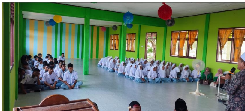
Gambar 3. Implementasi Program Kerja yang Efektif di SMA Negeri 6 Lhokseumawe

Anggota organisasi kesiswaan di SMA Negeri 6 Lhokseumawe menunjukkan kemampuan yang meningkat dalam mengembangkan dan mengimplementasikan program kerja yang lebih terstruktur dan efektif. Selama periode pendampingan, program-program yang dijalankan mencerminkan peningkatan yang signifikan dalam aspek perencanaan, pelaksanaan, dan evaluasi. Setiap langkah di dalam program kerja dirancang dengan lebih rinci dan sistematis, memastikan bahwa semua tujuan dan target dapat tercapai dengan optimal.