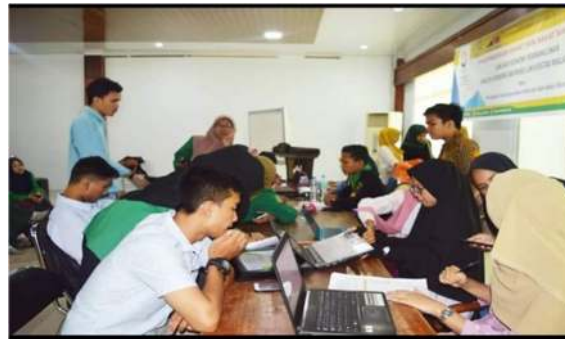
Gambar 2. Proses Praktik Pencarian Artikel

Praktik pencarian artikel dilakukan oleh mahasiswa dan didampingi tim pelaksana kegiatan. Hal ini perlu dilakukan untuk mengevaluasi pemahaman mahasiswa dari penyampaian materi tersebut.