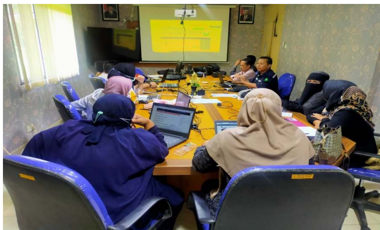
Gambar 1. Proses pemberian materi Diagram Alir

Pada tahap pertama yaitu penyampaian materi, peserta diberikan pemahaman mengenai mekanisme penerbitan jurnal. Tahap ini dilakukan selama 2 jam, yang meliputi penjelasan tentang proses penerbitan jurnal ilmiah dengan pemahaman melalui diagram alir. Tahap ini meliputi proses pengumpulan artikel, proses evaluasi artikel oleh reviewer yang ditunjuk, proses revisi artikel, pengeditan artikel yang telah dinyatakan Accepted , Pengiriman hasil penyuntingan artikel kepada penulis untuk dilakukan proofread , Permintaan Assignment of Copyright dari penulis, serta penerbitan jurnal ilmiah.