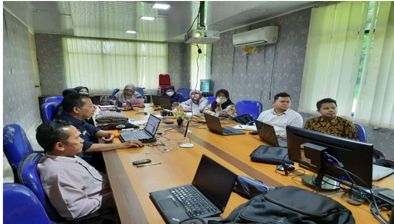
Gambar 2. Pengenalan fitur website

Tahap kedua merupakan tahap untuk proses awal penerbitan jurnal melalui portal OJS ( Open Journal System ). Tahap ini merupakan tahap dimana para pengelola jurnal diperkenalkan dengan fitur website penerbit jurnal masing-masing yang mana nantinya para pengelola jurnal akan secara langsung bekerja melalui laman website tersebut. Tahap ini dilakukan selama 2 jam dimulai dengan cara log-in website jurnal, memposisikan diri sebagai journal manager hingga cara set-up website jurnal masing-masing peserta.