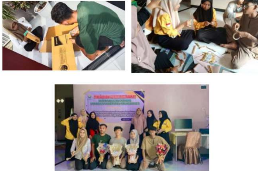
Gambar 2. Hasil Pelatihan Kewirausahaan pembuatan bucket snack, bucket bunga dan bucket foto bersama

Teknik pengerjaannya membutuhkan ketelitian dan kerapian sehingga mampu menghasilkan produk yang bernilai seni yang tinggi sehingga dapat diminati oleh banyak orang, khususnya kalangan remaja. kegiatan pembuatan bucket bunga dan bucket snack ini bertujuan untuk merangsang para peserta untuk berimajinasi dan berkarya secara spontanitas, sesuai dengan nilai, karsa dan rasa seni yang muncul dari dalam diri, sehingga secara langsung, peserta pelatihan dapat melakukannya dengan baik.