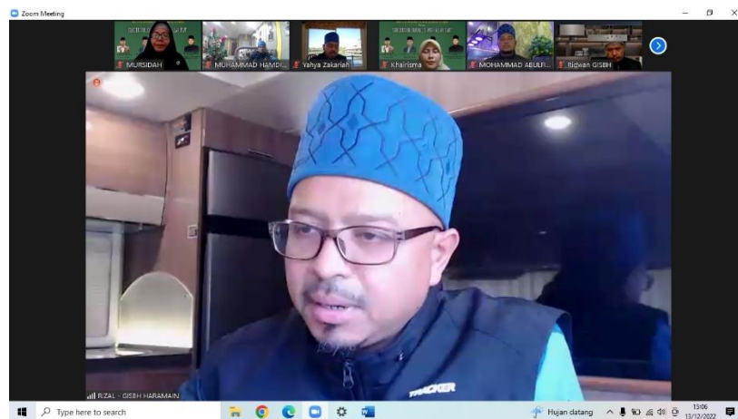
Gambar 2. Penyampaian Materi oleh Pemateri