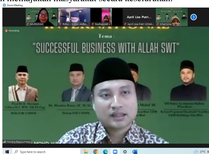
Gambar 1. Sambutan dari Ketua Panitia

Selain itu, kami akan membahas tujuan utama program ini, yang meliputi peningkatan pemahaman masyarakat tentang bisnis berbasis syariah, peningkatan keterampilan pengelolaan bisnis yang sesuai dengan prinsip-prinsip etika Islam, dan juga penciptaan peluang ekonomi yang berkelanjutan. Melalui kegiatan ini, kami berharap dapat membuka pintu bagi masyarakat untuk meraih kesejahteraan ekonomi yang sesuai dengan nilai-nilai agama mereka dan memajukan masyarakat secara keseluruhan.