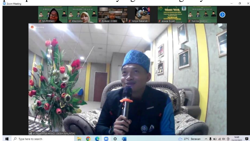
Gambar 4. Pengembangan wawasan dengan bisnis Syariah

Melalui seminar, peserta berhasil meningkatkan pemahaman mereka tentang konsep 'Successful Business with Allah SWT' dan prinsip-prinsip bisnis berbasis Syariah. Mereka dapat mengenali pentingnya transparansi, etika bisnis dalam Islam, dan bagaimana keberkahan dapat diperoleh melalui bisnis yang sesuai dengan syariah.