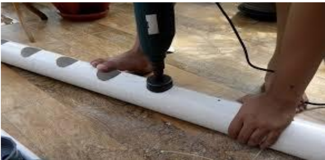
Gambar 1.3 Pelubangan pipa paralon untuk net pot

Tahap berikutnya adalah pembuatan lubang. Tanaman akan tumbuh di net pot jarring dengan media paralon. Net pot dengan banyak lubang untuk pertumbuhan akar. Langkah selanjutnya adalah mengebor lubang pada tutup wadah tempat net pot yang diletakkan. Hal ini membutuhkan alat khusus seperti bor, mata bor bulat, dan gergaji. Ukuran net pot yang digunakan harus lebih besar dari lubangnya agar tidak jatuh.