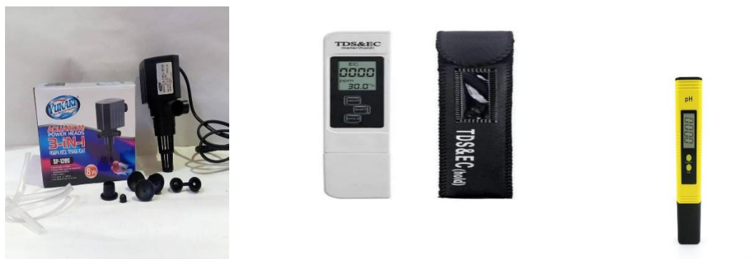
Gambar 1.6 Pompa Aquarium, TDS Meter, dan PH Tester

Setelah sesi pemaparan materi, dilanjutkan dengan tahap praktik lapangan. Pada tahapan ini, tim pengabdian mempersiapkan alat dan bahan pendukung untuk budidaya hidroponik seperti: (1).Alat pengukur nutrisi (tds ec), (2) Bibit tanaman kangkung dan media pembibitannya (rockwool), (3) Nutrisi AB-mix, (4) Pompa air, dan (5) Net pot berserta sumbu (kain flanel).