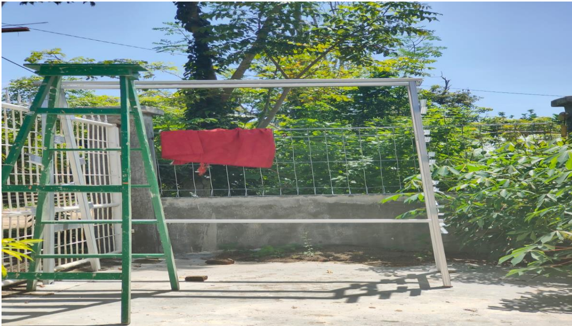
Gambar 1.2 Pembuatan Rangka Hidroponik

Kedua, tahap pelaksanaan. Tim Pengabdian mempersiapkan hidroponik dengan sistem (NFT) dengan tahap awal pembuatan rangka yang terbuat dari bahan baja ringan.