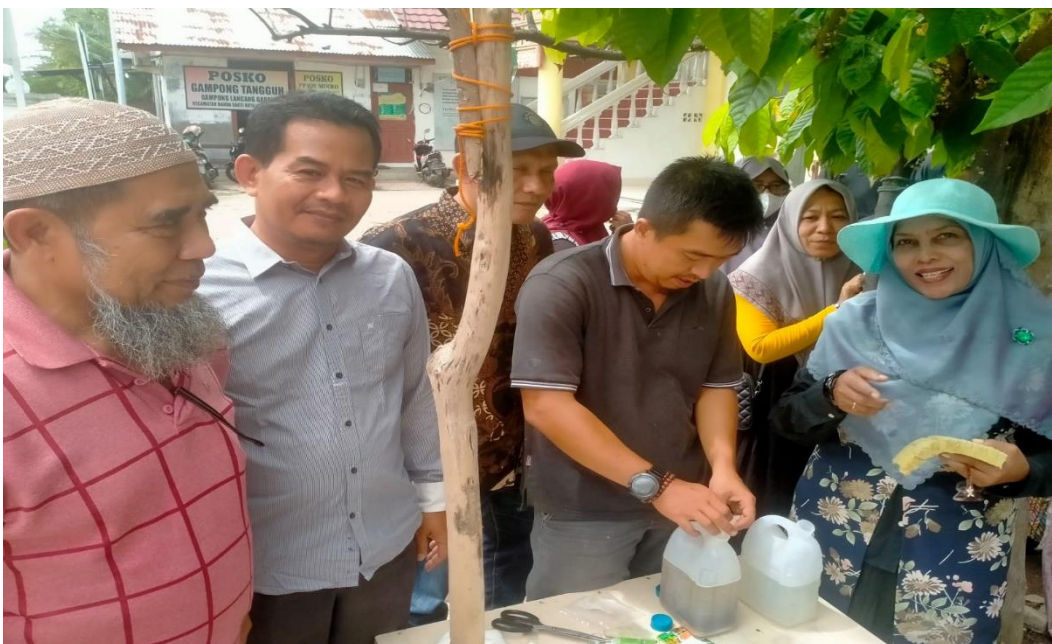
Gambar 1.8 Pencampuran Nutrisi AB-mix

Setelah melakukan penyemaian dan pembibitan tanaman, selanjutnya mempersiapkan nutrisi AB-mix, dan dosis kadar kepekatan untuk pemberian nutrisi tanaman kangkung adalah (1) minggu pertama 500ppm, (2) minggu kedua 800ppm, (3) minggu ketiga 1100 ppm, dan (4) minggu keempat 1400ppm (Lingga, 2011).