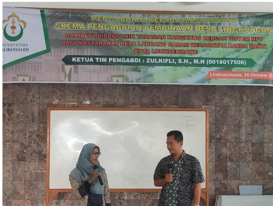
Gambar 1.5 Tim Pengabdian sedang menjelaskan Skema Hidroponik NFT

Setelah sesi pemaparan materi, dilanjutkan dengan tahap praktik lapangan. Pada tahapan ini, tim pengabdian mempersiapkan alat dan bahan pendukung untuk budidaya hidroponik seperti: (1).Alat pengukur nutrisi (tds ec), (2) Bibit tanaman kangkung dan media pembibitannya (rockwool), (3) Nutrisi AB-mix, (4) Pompa air, dan (5) Net pot berserta sumbu (kain flanel).