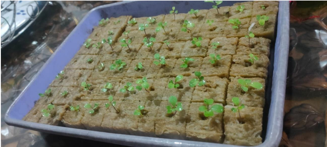
Gambar 1.7 Penyemaian dan Pembibitan Tanaman

Selanjutnya, mempersiapkan bahan untuk bibit tanaman kangkung, kemudian menjelaskan tahapan dalam proses penyemaian. Baki/wadah tanam yang dirancang untuk berkecambah banyak biji sekaligus dengan cara menahannya rapat-rapat. Baki ini tersedia dalam berbagai bentuk dan ukuran, dan harus menggunakan baki yang memiliki kedalaman sekitar 5-6 inci untuk mendapatkan hasil terbaik. Baki tumbuh tidak hanya akan menampung benih tetapi juga berisi larutan nutrisi. Ini memasok nutrisi penting untuk menanam benih untuk perkecambahan dan perkembangan yang tepat.