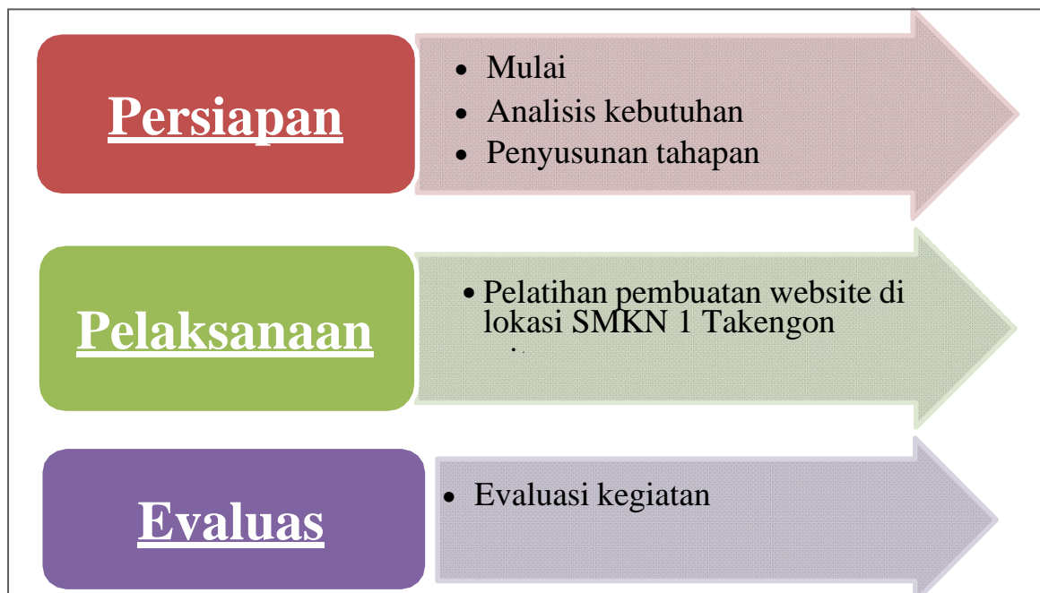
Gambar 1. Grafik Alur Kegiatan

Kegiatan Pelaksanaan Program Kemitraan Masyarakat terbagi menjadi tiga tahap, yaitu persiapan, pelaksanaan, dan tahap evaluasi. Berikut ini adalah grafik alur kegiatan yang akan dilaksanakan: