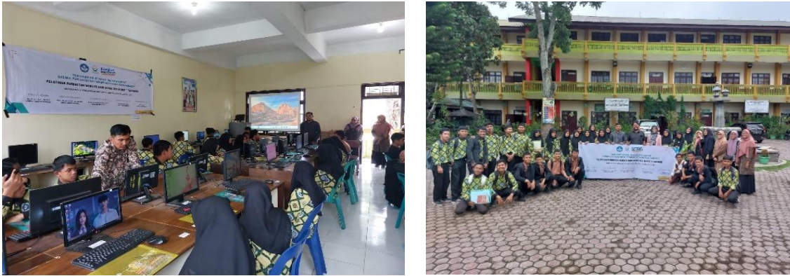
Gambar 3. Pelatihan Pembuatan Website Di SMKN 1 Takengon