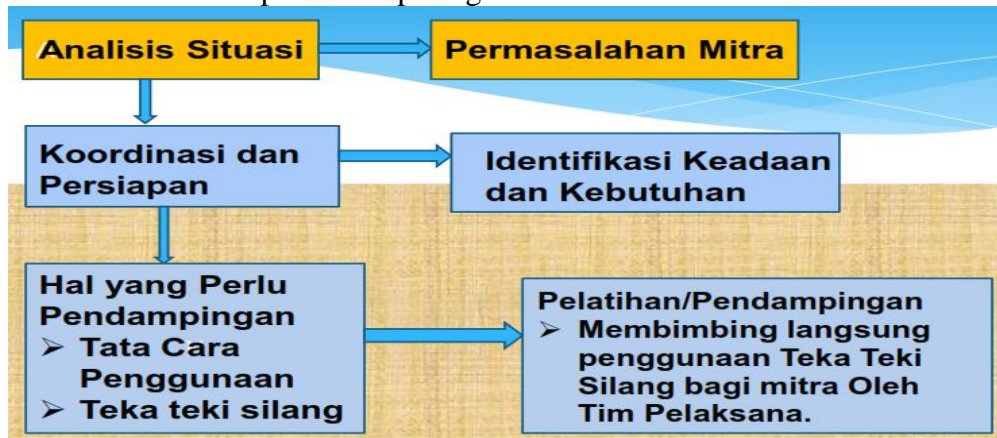
Gambar 1: Skema solusi penyelesaian masalah mitra

langsung, metode yang dilakukan sebagai berikut: Team pelaksanaan kegiatan pengabdian langsung mengimplementasikan Teka Teki Silang pelajaran PAI secara langsung bagi santri kelas I MTs. (2) Dalam pengabdian ini mitra diberi pelatihan cara penggunaan media pembelajaran teka teki silang yang baik dan benar untuk meningkatkan kemandirian belajar, (3) Team pelaksana kegiatan Pengabdian ini memberi pendampingan dan bimbingan secara langsung bagi santri MTs kelas I Pasantren Terpadu Syamsuddhuha Cot Murong Aceh Utara sampai mitra bisa menggunakan Teka Teki silang Pelajaran PAI dengan mudah dan mandiri dan (4) Evaluasi dilakukan untuk mengukur kepraktisan dan efisien Teka Teki Silang sebagai media pembelajaran PAI. Metode solusi tersebut dapat dilihat pada gambar berikut: