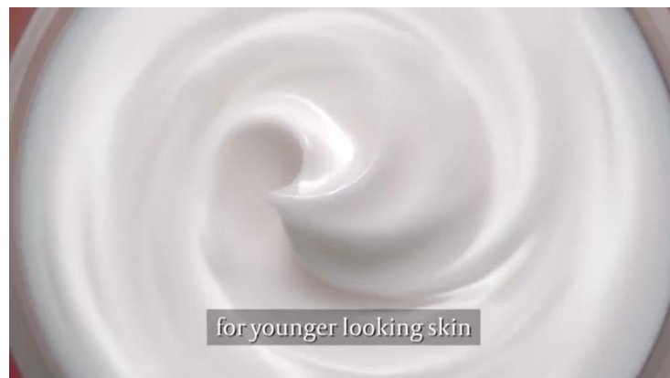
Gambar2. Penggambaran produk SK II R.N.A Airy

Lebih lanjut untuk mendekati calon “pemuja kemudaan” potensial mereka dalam iklan baik yang tayang di TV komersil maupun media sosial dengan cara menggunakan Bahasa misterius. Penggunaan bahasa misterius ini seperti penggunaan Bahasa Latin dalam agama Katholik, agama Yahudi menggunakan Bahasa Hebrew, atau Mason yang menggunakan password [11]. Hal ini dapat dilihat dalam iklan SK II R.N.A Airy dan di dalam laman resmi milik SK II https://www.sk-ii.com/our-products dan https://sk-ii.co.id/our-products untuk laman resmi SK II Indonesia.