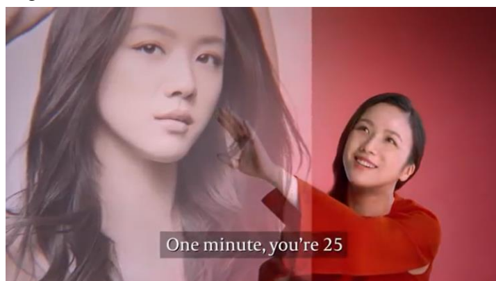
Gambar1. cuplikan iklan SK II R.N.A Airy.

Implikasi penjualan dengan model menciptakan rasa bersalah yang besar terhadap perempuan menurut Wolf mirip dengan kenyataan didalam doktrin Kristen. Seorang pemuja yang tidak merasa bersalah tidak bisa dihitung memberikan dukungan kepada gereja. Seorang perempuan yang tidak merasa bernoda tidak dapat diandalkan untuk menghabiskan uangnya untuk “perbaikan diri-nya”. Dosa asal adalah sumber dari rasa bersalah. Rasa bersalah adalah pengorbanan yang menjadi konsekuensinya jugalah yang membentuk pusat gerakan dari ekonomi relegius yang lebih baru [11].