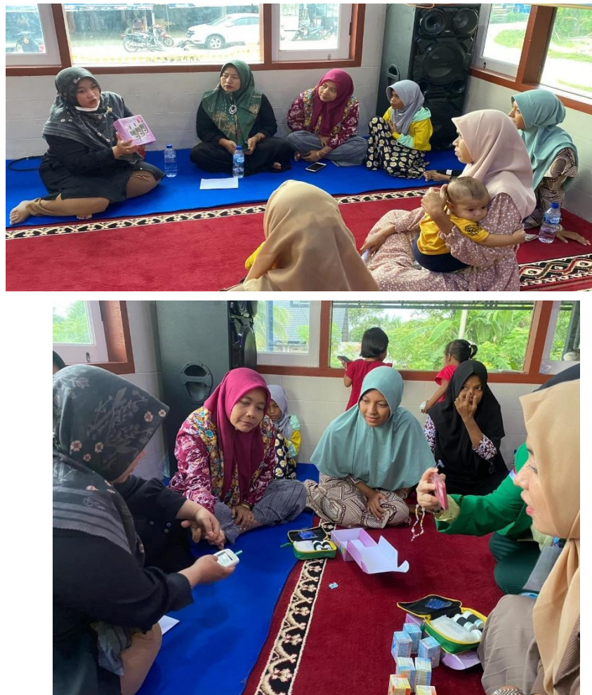
Gambar 3. Edukasi penggunaan alat pemeriksaan kimia darah kepada Kader Lansia

terkena penyakit kronik atau tidak. Pada pengabdian ini kami melatih kader lansia untuk dapat memeriksa ketiga kadar kimia darah tersebut menggunakan alat Aquacheck yang bermerk Easy touch. Pemilihan alat ini karena alat ini ditujukan untuk orang awam dan pemakaian yang mudah dimengerti. Alat Accu check lengkap dengan strip dihibahkan ke Desa Keutapang agar di Desa Ketapang bisa melakukan pemeriksaan kimia darah pada lansia 3 bulan sekali mengingat Faskes I pada Desa ini sangat jauh. Desa Keutapang merupakan Desa Binaan Fakultas Kedokteran Universitas Malikussaleh sehingga keberlangsungan program ini dapat dievaluasi.