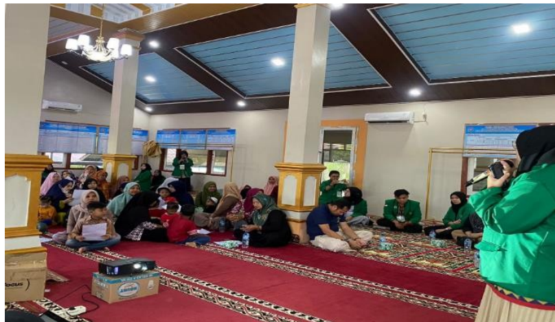
Gambar 1. Pemaparan Materi tentang Minyak Jelantah

minyak goreng bisa sampai 7x pemanasan karena alasan ekonomi dan kurangnya pengetahuan terkait pengaruh minyak jelantah terhadap kesehatan. Minyak goreng yang telah dipanaskan sampai 7x mampu mempertinggi kadar asam lemak yang dapat meningkatkan risiko penyakit jantung dan diabetes, hal ini bisa beresiko lebih besar pada lansia karena metabolisme tubuh yang terus menurun. Masyarakat saat antusias mendengarkan pemaparan materi dan banyak yang bertanya. Sebelum dipaparkan materi peserta diberikan kuesioner untuk dijawab sebagai pretes, dan 1 minggu kemudian diberikan lagi kuesioner yang sama sebagai postes. Terlihat terjadi peningkatan pengetahuan tentang minyak jelantah dari 30 persen yang berpengetahuan baik saat pretes menjadi 81 persen saat postes.