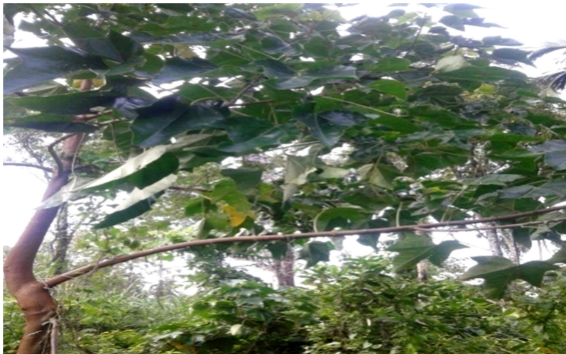
Gambar 3.damar ( Agathis dammara )

Tumbuhan pohon-pohonan yang mendominasi ladang masyarakat di kawasan subDAS ini adalah damar ( Agathis dammara ), kayu kulit manis ( Cinnamomum verum ), surian ( Toona sureni )