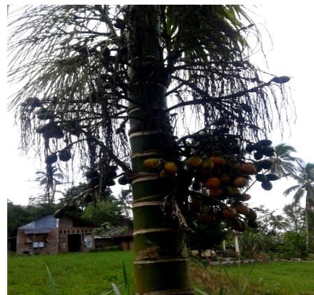
Gambar 6. Pinang ( Areca catechu L)

kakao ( Theobroma cacao ), pepaya ( Carica papaya ), jeruk ( Citrus x sinensis ) dan pisang ( Musa acuminata , M. balbisiana , M. Paradisiaca )