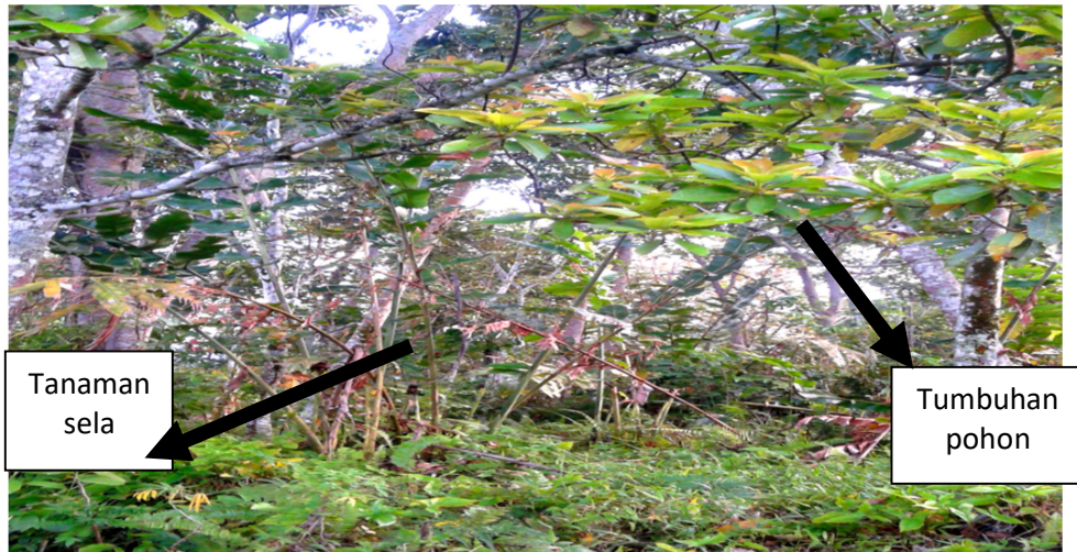
Gambar.2 Sistem pengolahan lahan secara konservasi, yaitu Wanatani dengan jenis pertanaman sela.

Tumbuhan pohon-pohonan yang mendominasi ladang masyarakat di kawasan subDAS ini adalah damar ( Agathis dammara ), kayu kulit manis ( Cinnamomum verum ), surian ( Toona sureni )