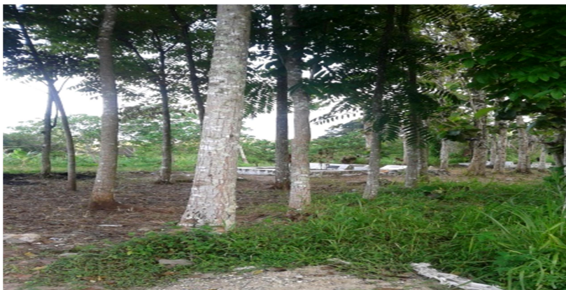
Gambar 4. kulit manis( Cinnamomum verum )