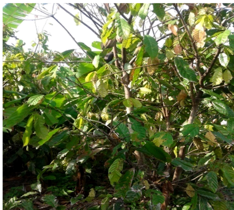
Gambar 5. Kakao ( Theobroma cacao )

sedang tanaman sela yang dijumpai adalah pinang ( Areca catechu L), lengkuas ( Alpinia galanga ), jahe ( Zingiber officinale ), temulawak ( Curcuma xanthorrhiza ),