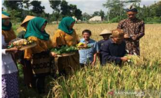
Gambar 1. Tradisi Wiwitdi Wedomartani, Sleman

perubahan sosial budaya di masyarakat sebagai akibat ketidaksesuaian antara sistem kepercayaan dan realitas sosial yang dihadapi masyarakat. Menurut Weber, realitas harus sesuai dengan kepercayaan.