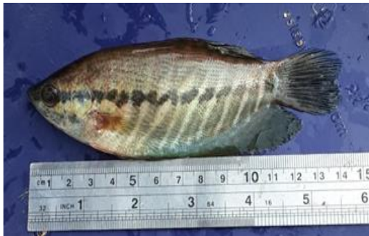
Gambar 1. Ikan Sepat yang dikoleksi di perairan Rawa Desa Lakea Dua

Hasil pengukuran panjang total ikan sepat yang tertangkap di perairan rawa Desa Lakea Dua Kabupaten Buol yaitu 10-18 cm (100-180 mm). Hasil pengukuran ini lebih besar dari yang di laporkan oleh (Jusmaldi et al., 2021), kisaran panjang total ikan sepat ( T. pectoralis ) yang dikoleksi Bendungan Lempake, Kalimantan Timur adalah 31,68-103,53 mm. (Herliwati & Rahman, 2013) di kolam rawa Danau Bangko Kalimantan Selatan yang mendapatkan kisaran panjang 64-125 mm. Selanjutnya ukuran ikan dalam penelitian ini juga lebih besar dari kisaran panjang total ikan Sepat 112-121 mm yang dilaporkan oleh (Cuadrado et al., 2019) di Danau Esperanza, Agusan del Sur, Filipina. Perbedaan panjang ikan sepat diduga disebabkan faktor geografis, kondisi lingkungan reproduksi ikan. Menurut (Jusmaldi et al., 2020) menyatakan bahwa ikan nilam yang hidup di perairan Waduk Benanga Kalimantan Timur yang mengalami perbedaan wilayah geografis dengan kondisi perairan berbeda dan hal tersebut merupakan salah satu faktor utama penyebab terjadinya perbedaan ukuran panjang total ikan. Selanjutnya (Li & Gelwick, 2005) menyatakan pertumbuhan ukuran panjang maksimal pada ikan berkaitan dengan kondisi lingkungan perairan yang baik dan tersedianya sumber makanan. (Jusmaldi et al., 2021), menambahkan siklus reproduksi ikan dapat memengaruhi ukuran panjang ikan yang tertangkap pada waktu pengambilan sampel.